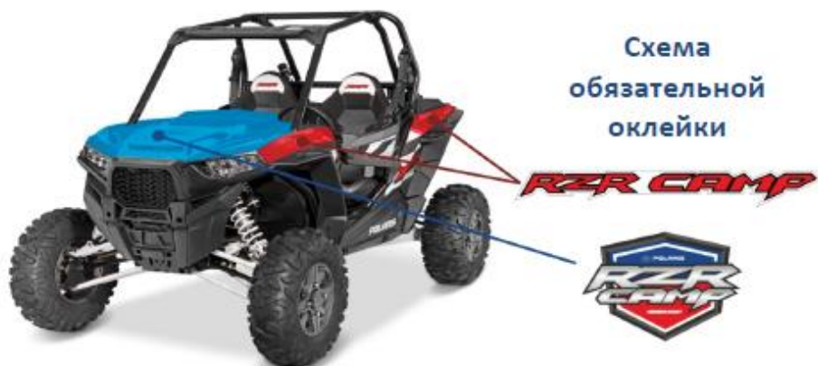
СХЕМА ОКЛЕЙКИ ATV