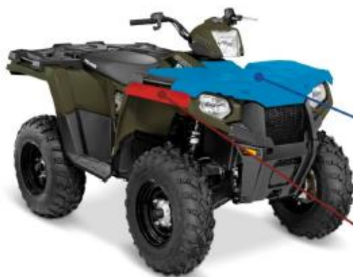
Схема обязательной оклейки