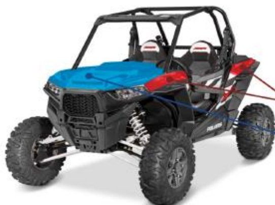
Схема обязательной оклейки